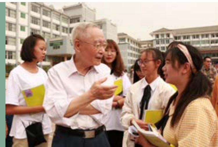
中国工程院徐志磊院士与我院学生亲切交流

在这里，有一群锐意进取、改革创新、学识渊博、技艺高超、爱岗敬业、乐于奉献的教师，他们致力于创办“更好的教育”。在我们的希冀中，“更好的教育”是一种高尚、优雅的教育，绽放着知识殿堂的光芒；“更好的教育”是一种关怀、幸福的教育，充盈着温暖成长的师爱。