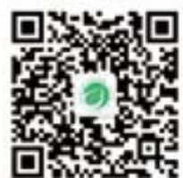
扫码关注学校动态

学校地址：玉溪市红塔区研和街道向家庄41号 招生咨询点：玉溪市红塔区许家湾路26-1号 电话：0877-2681098 学校网址： http://www.yxnzy.net/ 学校招生就业网： http://zsjy.yxnzy.net:81/ 学校办公室电话：0877-2991214（传真） 招生就业处电话：0877-2990071（传真）/2295193 学校资助热线：0877-2991720 2991715 招生就业处邮箱： yxnzyzjc2019@126.com