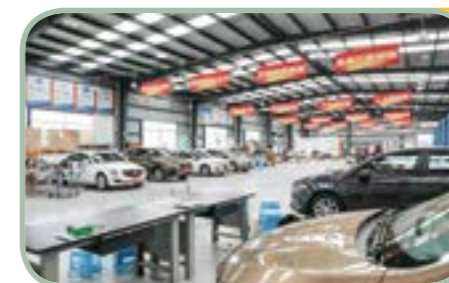
晋宁区中 等专业学校