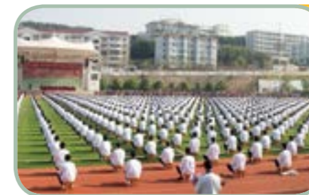
玉溪第二职 业高级中学