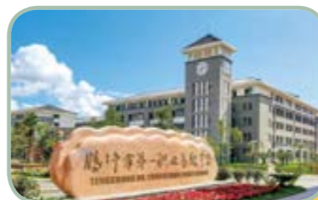
腾冲第一职 业高级中学