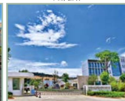
中烟施伟策（云南）再造烟叶有限公司