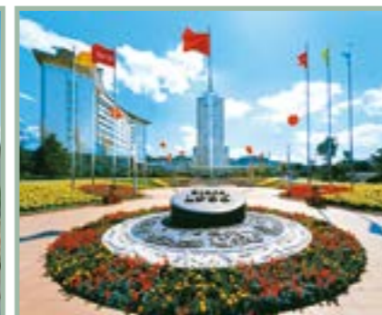
红塔烟草（集团）有限责任公司