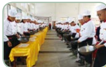
昌宁县职业 技术学校