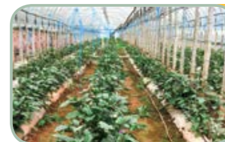
金平县职业 高级中学