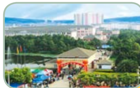
玉溪工业 财贸学校