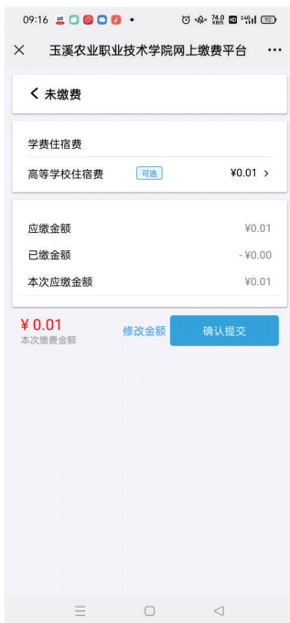
(4) 点击确认提交进行缴费