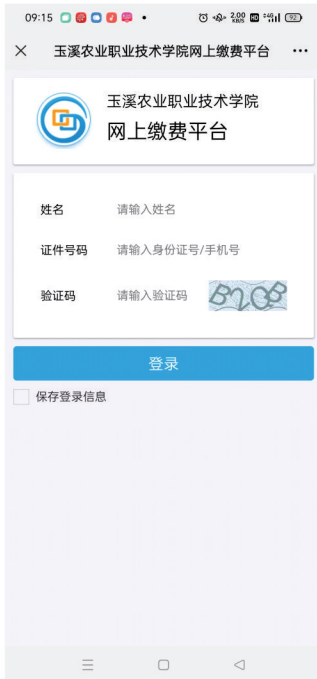
(2) 输入学生姓名、证件号码、验证码登录后获取待缴费信息