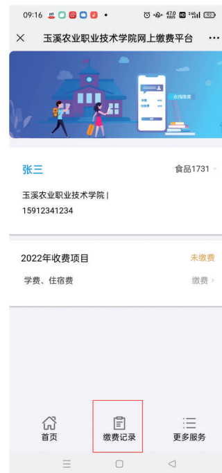
(5) 点击缴费记录查看已缴费的信息