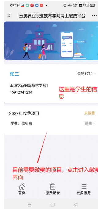
(3) 选择缴费项目并核对缴费金额